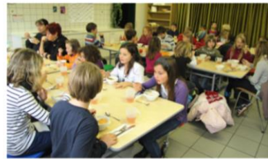
Mittagessen im Ganztagesbetrieb